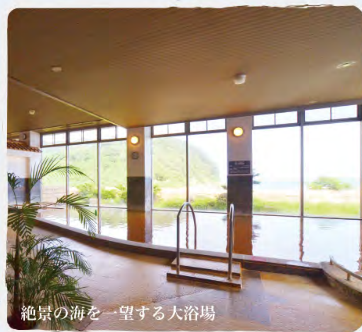
絶景の海を一望する大浴場