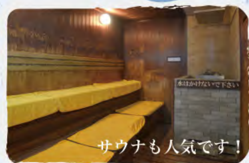
サウナも人気です!

TEL:095-893-1133 FAX:095-893-1135 info@nomozaki.or.jp