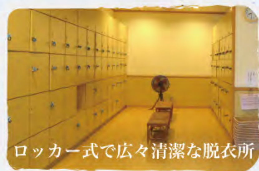
ロッカー式で広々清潔な脱衣所